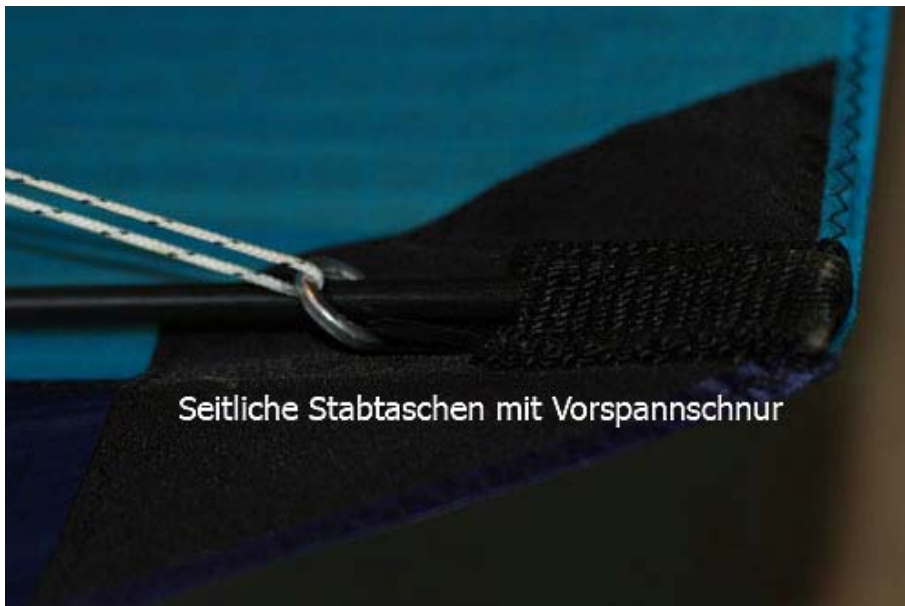
Seitliche Stabtaschen mit Vorspannschnur