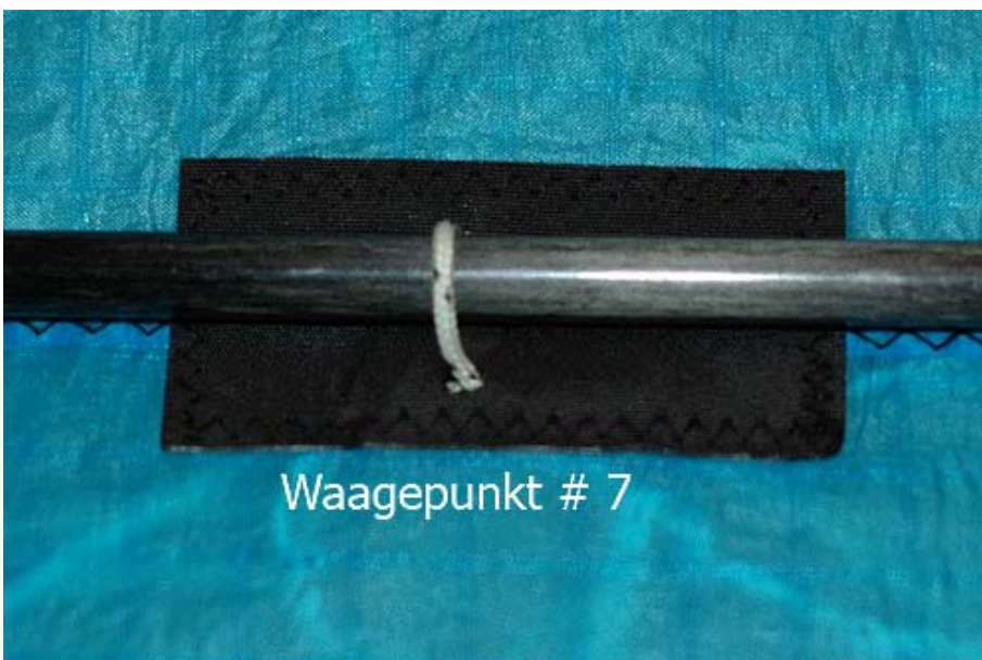
Waagepunkt # 7